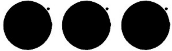
Fig. 5: Signe spécial international pour les ouvrages et installations contenant des forces dangereuses

4 De nuit, ou par visibilité réduite, le signe peut être éclairé ou illuminé; il pourra également être fait de matériaux le rendant reconnaissable par des moyens techniques de détection.