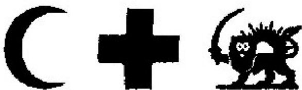
Fig. 2: Distinctive emblems in red on a white ground

2 At night or when visibility is reduced, the distinctive emblem may be lighted or illuminated; it may also be made of materials rendering it recognizable by technical means of detection.